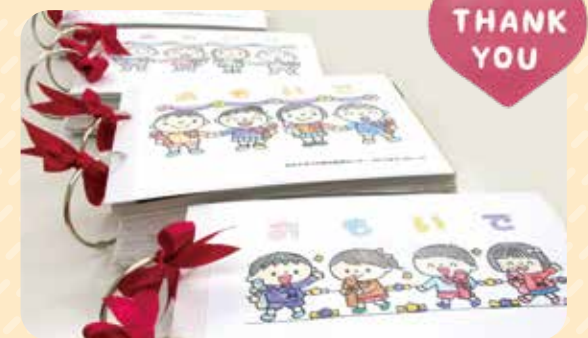
保護者、子どもたちから贈呈された記念アルバム