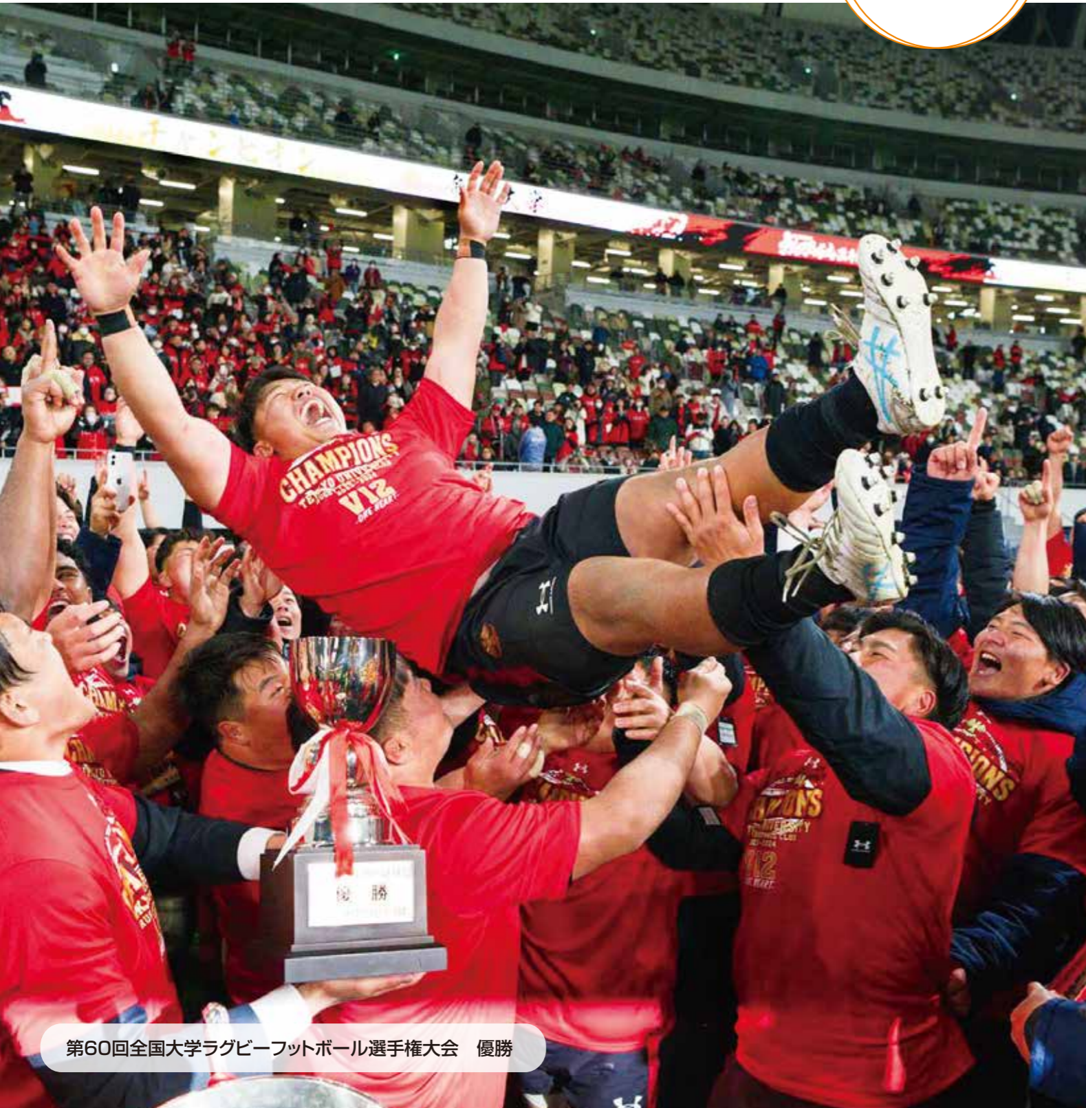
第60回全国大学ラグビーフットボール選手権大会 優勝