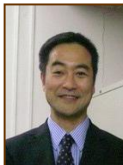
Ichiro Kawachi ハーバード公衆衛生大学院 社会疫学学科・科長